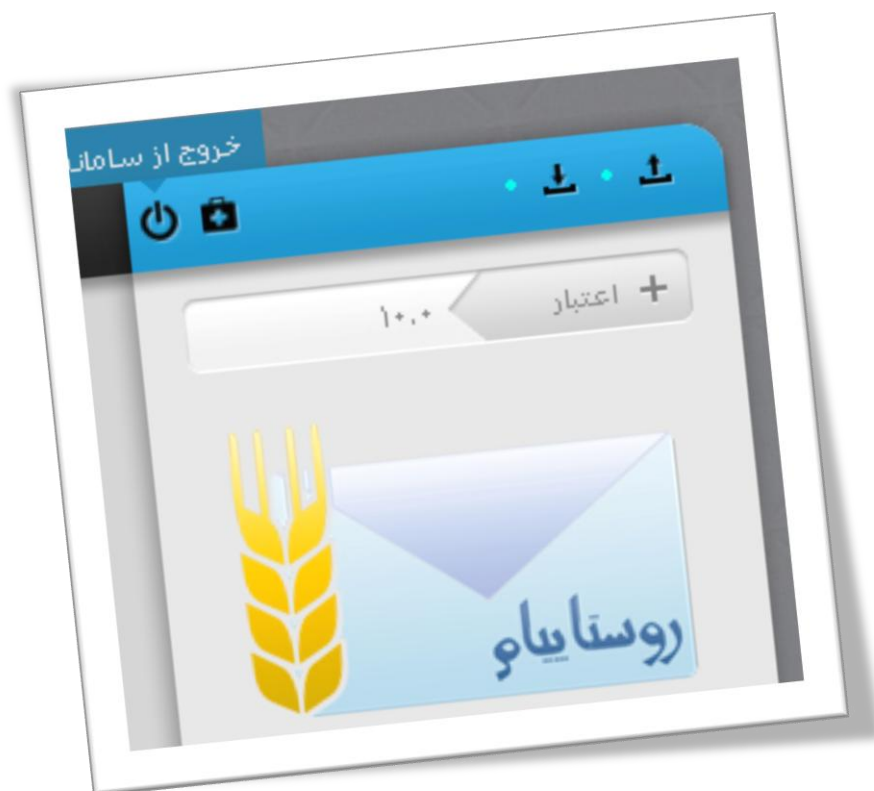
نمای سمت راست پنل

جهت خروج از پنل بر روی علامت خروج واقع در بالای صفحه کلیک می‌کنیم.